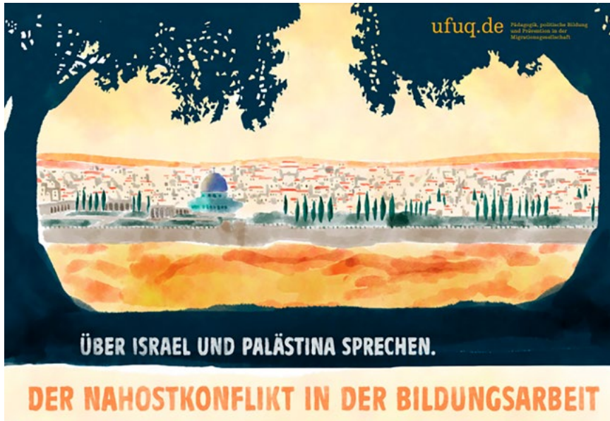
Abbildung 2: Cover der Arbeitshilfe „Über Israel und Palästina sprechen. Der Nahostkonflikt in der Bildungsarbeit“ (2023)

Hinweis II: In unserer Arbeitshilfe „Über Israel und Palästina sprechen. Der Nahostkonflikt in der Bildungsarbeit“ finden Sie Hinweise auf weiterführende Materialien zur inhaltlichen Vertiefung des Themas, aber auch zum Umgang mit antisemitischen und rassistischen Äußerungen ( hier zum Download ).