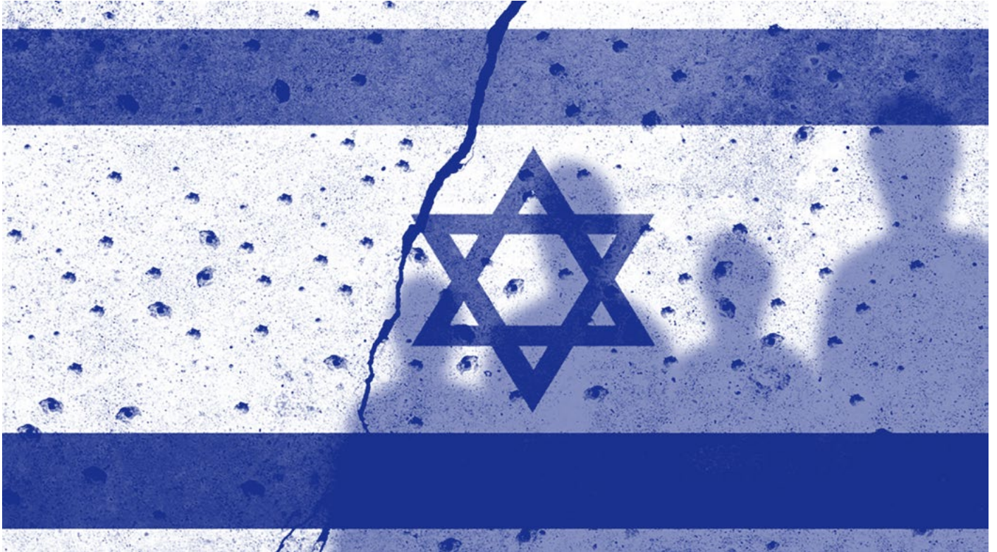
Abbildung 1: Israelische Flagge auf einer Mauer mit Rissen und Einschusslöchern