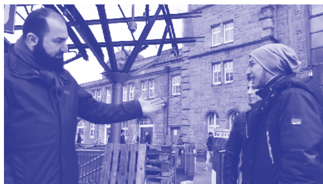
Jeunes réfugiés en conversation sur un stand de militants salafistes à Hambourg.

Les initiatives salafistes ciblent les réfugiés et leur offrent un soutien.