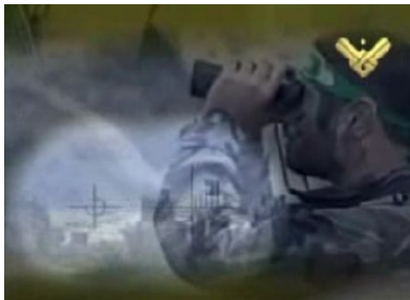
Hisbollah-Kämpfer auf Al-Manar , dem Sender des libanesischen "Widerstands"

Das Verbot Al-Manars ist demnach Teil einer globalen Verschwörung, die sich gegen die eigentlichen Interessen aller Menschen richte. Die Macher des Muslim-Markts hoffen daher auch unter Nicht-Muslimen Unterstützung für ihre Weltsicht und eine „islamische Alternative“ zu gewinnen. ■