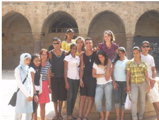
Berliner Jugendliche in Akko ...

von dem Gefühl, dass sich hier in Deutschland niemand für sie und ihre Geschichte interessiert. Dies dürfte auch ein wesentlicher Grund dafür gewesen sein, dass der Workshop für sie außerordentlich wichtig wurde und sie es als etwas Besonderes betrachteten, daran teilnehmen zu können. Die Ergebnisse des Workshops präsentierten sie in Form einer Ausstellung: Zur Geschichte der Palästinenser und ihrer Migration seit den 30er Jahren verfassten die Jugendlichen eigene Texte und machten sich zudem auf die Suche nach der eigenen Biografie, indem sie Fotos, Dokumente und Erinnerungsstücke aus ihren Familien zusammen trugen. Auf