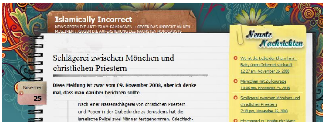
Islamically Incorrect : Dawa gegen anti-islamische Hetze

indem Beispiele für die vermeintliche Dekadenz, Kriminalität und Verkommenheit der nicht-islamischen Gesellschaft präsentiert werden, von der sich Muslime abgrenzen sollten. Auch der Hinweis auf einen drohenden Holocaust ist in diesem Sinn zu verstehen: Der den Muslimen entgegen schlagende Rassismus sei so