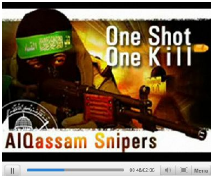
Sympathien für Hamas auf der MySpace-Seite eines Libanesen aus Essen: "Scheiss auf Amerika und Juden"

4. Pädagog/innen vollziehen dabei einen schwierigen Balanceakt: Sie müssen zwischen realen Erfahrungen und solchen verzerrenden Darstellungen etwa der israelischen Politik unterscheiden, die Ausgangspunkt von Feindbildkonstruktion und Ideologiebildung sein können. Dazu müssen sie Alternativen zu einseitigen Deutungen von Ereignissen im Nahen Osten aufzeigen. Das setzt neben großer Sensibilität historische Kenntnisse voraus. Schließlich geht es nicht nur um „Sichtweisen“ und Meinungen, sondern auch um Fakten.