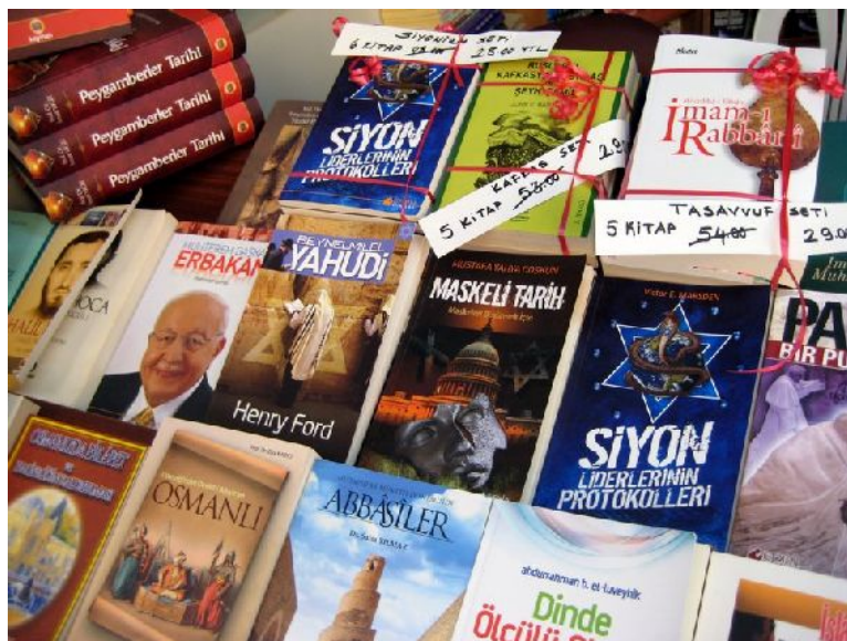
Antisemitische Publikationen auf einer Buchmesse in Istanbul

1. Nicht jede unverhältnismäßige und emotionale Kritik an Israel ist Zeichen eines antisemitischen Weltbildes. Gelassenheit und gezieltes Nachfragen ist in der Auseinander-