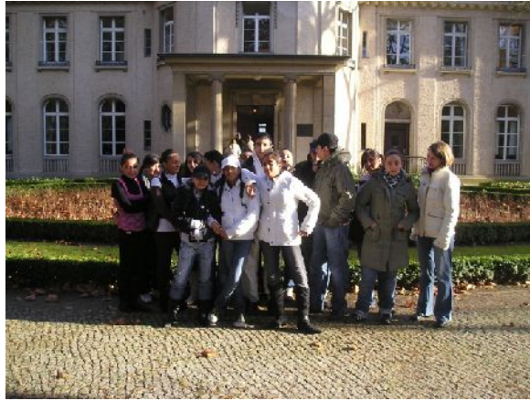
... und vor dem Haus der Wannsee-Konferenz

So setzten sich die Jugendlichen mehrheitlich sehr offen mit der Geschichte des Nationalsozialismus auseinander, stellten jedoch immer wieder kausale Zusammenhänge zum aktuellen Nahostkonflikt her, ohne über Kenntnisse zu Geschichte und Gegenwart von Konflikt und Region zu verfügen. Also entstand die Idee, eine Studienreise nach Israel und Palästina durchzuführen. Tatsächlich konnte die Gruppe im August 2008 ihren Fragen direkt vor Ort nachgehen: In israelischen Museen vertieften sie ihr Wissen über Nationalsozialismus und Holocaust und sie besuchten die Herkunftsorte ihrer Großeltern. Sie zeigten sich erstaunt über die Lebensumstände in einem Flüchtlingslager und über die arabisch-israeli-