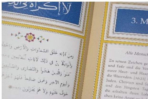
„Der Koran. Für Kinder und Erwachsene“