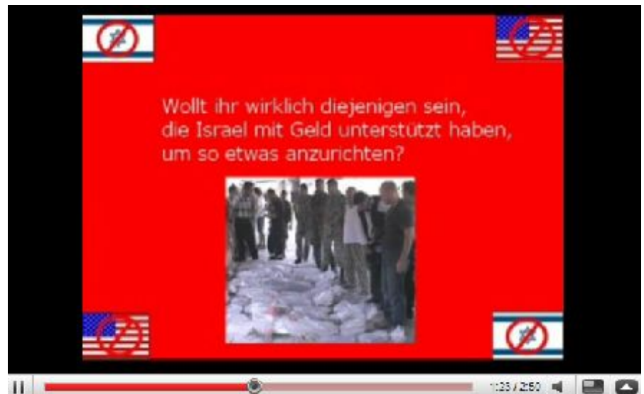
Aufruf zum Boykott von "zionistischen Produkten" auf Youtube

Zur Begründung von Judenhass können aus islamischen Quellen abgeleitete Motive eine Rolle spielen, meist sind sie aber zweitrangig. Häufiger geben die Jugendlichen den Nahostkonflikt an, wenn sie nach dem Grund für Israelhass und antisemitische